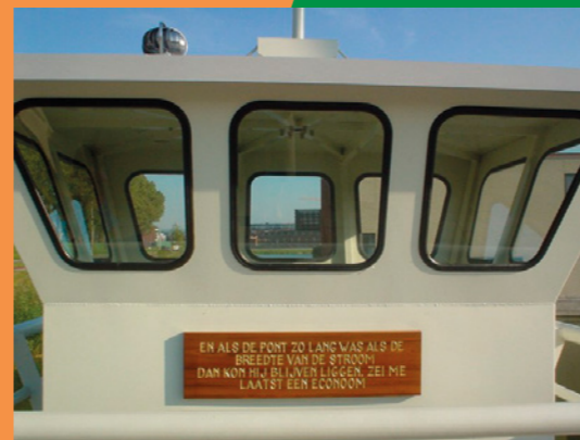
'Veerpont' Barendrecht, de stuurhut*