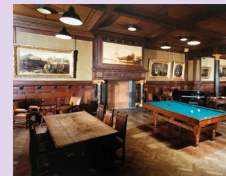
Boven de schouw het schilderij Gezicht op Wittenburg en links en rechts daarvan schilderijen uit de Historische Galerij, 1988

Bronnen: Notulen bestuursvergaderingen 1947; jaarverslagen; Een Vereeniging van ernstige kunstenaars en Artacula 4. Vermelding op pag. 598 van Elsevier's Geïllustreerd Maandschrift 4 (1894) VII, het schilderij behoorde toe aan Arti.