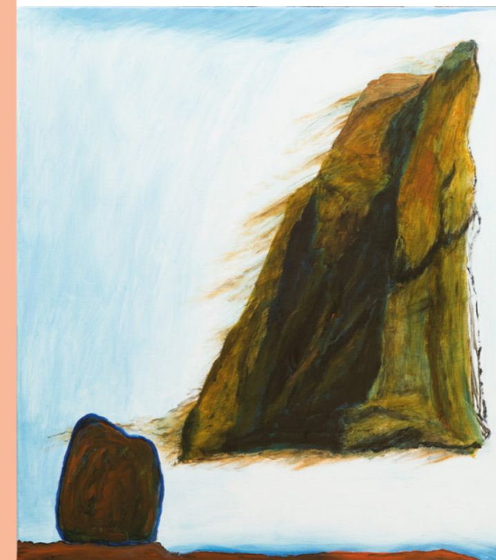
Een herinnerde steen een verplaatste berg, 2018

Bijna als laatste van zijn publicaties, voor hij bij een auto-ongeluk om het leven komt, schrijft hij onder de titel Luftkrieg und Literatur een studie over de honderden bombardementen op Duitse steden door de Engelse luchtmacht, een moorddadige tactiek, weliswaar door de Duitsers uitgevonden (Guernica, Rotterdam, Londen, Coventry), maar waarvan de doelmatigheidsvraag nog gesteld moet worden. Dacht men werkelijk dat de burgerbevolking zich dan wel tegen het naziregime zou keren?