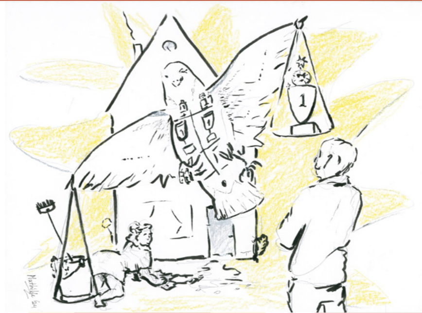
tekening Mathilde muPe

Wat mijn vader in concentratiekamp (Polizeiliches Durchgangslager) Amersfoort ondanks alle ontberingen op de been hield, waren de gedachten aan zijn gezin en zijn sierduiven. Toen hij na zijn vrijlating in de winter van '44-'45 dolgelukkig in de armen van zijn vrouw werd gesloten, wachtte hem een volgende tragedie. Door honger en geldgebrek gedreven had mijn moeder de duiven uit het hok gehaald en tijdelijk in Artis ondergebracht. Zij zouden het daar echter niet overleven. Ik ben er niet bij geweest, maar de aanblik van dat lege duivenhok op zolder moet voor mijn vader onverteerbaar zijn geweest. Het was een aanvullend onderdeel van het opgelopen trauma waarmee hij gedurende zijn verdere leven moest zien om te gaan. Mede door zijn duivenliefde – hij bouwde langzaam een nieuwe selectie op – heeft hij zich er manmoedig doorheen geslagen. Als secretaris van sierduivenvereniging DVS (Door Vriendschap Sterk) onderhield hij intensieve