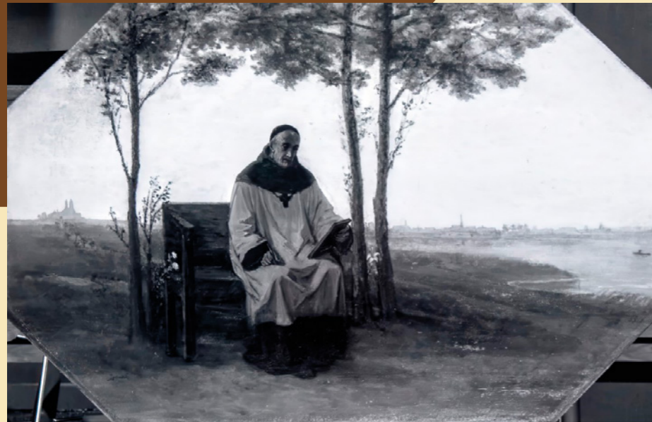
Jozef Israëls, Thomas à Kempis in het jaar 1460 (1861/1862)