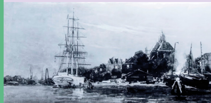
Gezicht op Wittenburg door H.W. Jansen