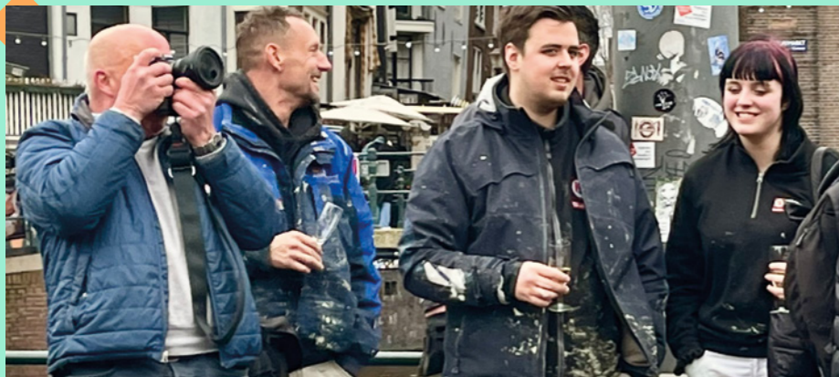
Bouwvakkers en schilders genieten van het bijzondere moment

Arti en traditie gaan goed samen. Daarom was, toen de verbouwing het hoogste punt bereikt had, het moment daar voor pannebier. Volgens Van Dale staat pannebier voor een feestje aangeboden door de opdrachtgever aan de bouwvakkers 'als de pannen op het dak liggen, thans veelal vervangen door een fooi'. Van fooien moet Arti weinig hebben, van een feestje des te meer. Dus werd op woensdagmiddag 21 februari gevierd dat de Artivlag in top kon. Boven op het dak, trots uitstekend boven de enorme stelling die de voorgevel nog aan het zicht onttrok.