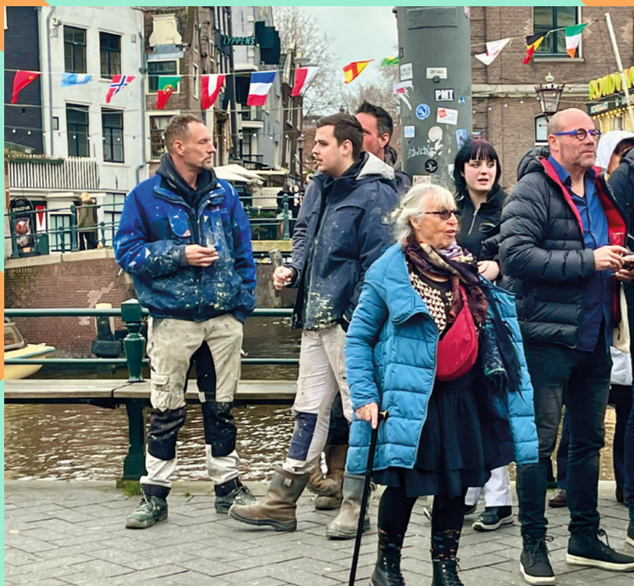
Artileden en werklui verzamelen zich aan de waterzijde van het Rokin