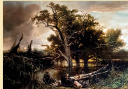
J.W. Bilders, Neêrlands woeste toestand