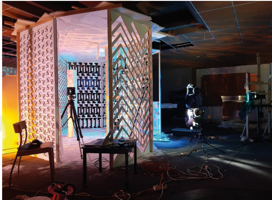
Jan Theun van Rees, 'Ruimte'

Jan Theun richt zich in zijn werk op de perceptie van de ruimte om ons heen. Zo maakt hij foto's van ruimtes die doorgaans onopgemerkt blijven. 'Verborgene ruimtes' zoals hij ze noemt. Soms manipuleert hij met gordijnen en doeken de lichtinval in bestaande ruimtes en legt daarmee de aandacht op de ruimtelijke kwaliteiten. Andere keren bouwt hij de ruimte zelf. Die ruimtes worden nooit als ruimte of installatie geëxposeerd. De ruimtes bestaan dus enkel op het moment dat Jan Theun ze bouwt en de foto is het enige 'bewijs' dat de ruimte er ooit was.