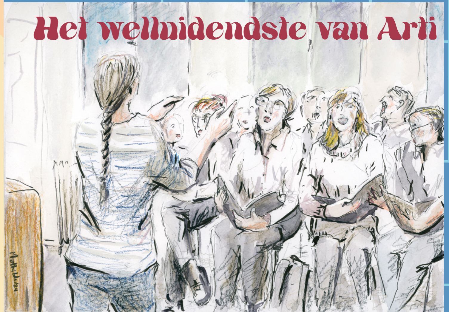
tekening Mathilde muPe