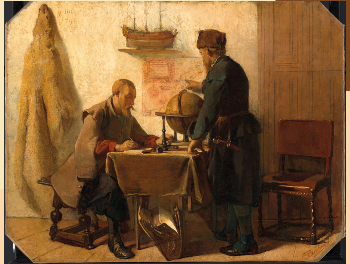
Christoffel Bisschop, Jacob van Heemskerck en Willem Barents bereiden een reis voor (1862), olieverf op doek, Rijksmuseum