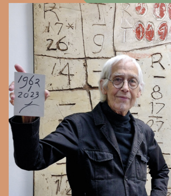
... kunstwerken als geduldige wachtters ...