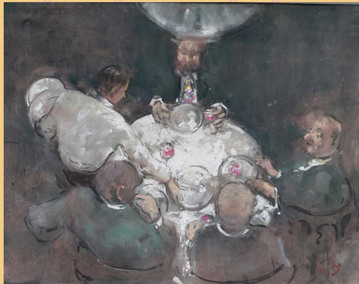
Herentafel, Arti – De jarige. Pastel/gem. techniek op papier (maart 2023)