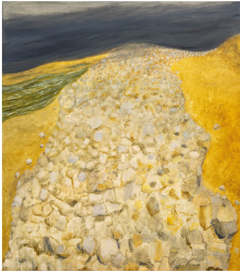
Grindbank aan zee, 2020

Zo stelt hij ook aan het begin van zijn schrijversloopbaan, die hem grote internationale faam zou opleveren, omdat hij vragen stelt die niet eerder aan de orde kwamen, dat het merendeel van de naoorlogse Duitse schrijvers, op enkele uitzonderingen na, nalaat over de schande van hun vaderland te schrijven en in een interview zegt hij nuchter dat hij van schaamte nooit iets gemerkt heeft.