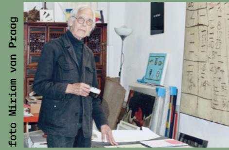
... een avontuur dat hopelijk nog niet is afgesloten ...